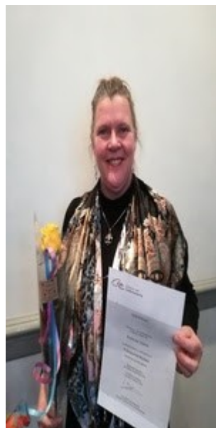
Professioneel Mediator met een zesde zintuig