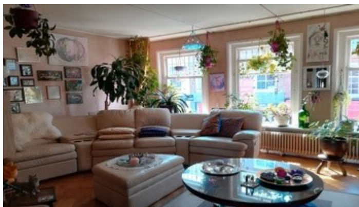
JE BENT VAN HARTE WELKOM IN MIJN HUISKAMER!

Reserveren: mobiel: 06- 41041 509, of nickysplace@gmail.com