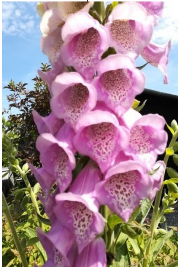
De natuur op haar mooist!

* Dit afsluiten is eenvoudig... klik in dezelfde instelling op 'Meer opties' en ga naar [Beheer toekomstige activiteit] en zet hem eventueel UIT. Aanmelden bij andere met via Facebook kan dan ook niet meer.