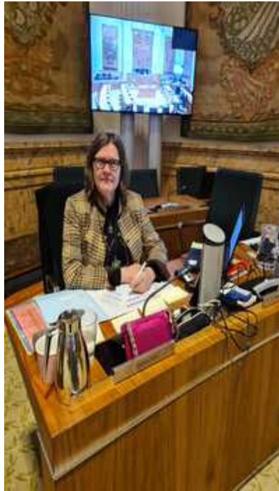
Dit is mijn werk omgeving.

Een perfect cadeau voor jezelf om met veel inzichten je leven te vervolgen en van klacht naar KRACHT te bewegen.