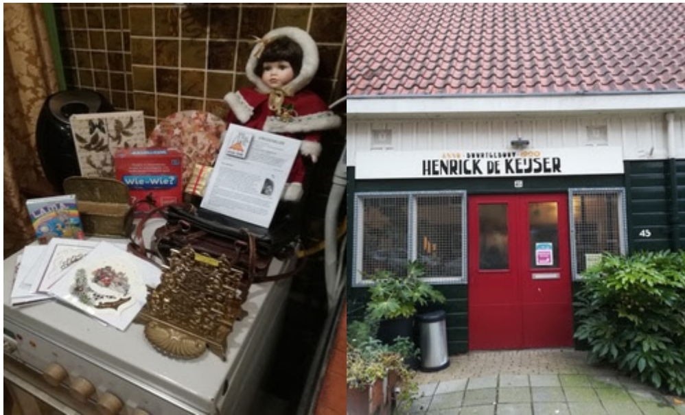
Mijn prachtige nieuwe spulletjes en het speeltuingebouwtje in Amsterdam