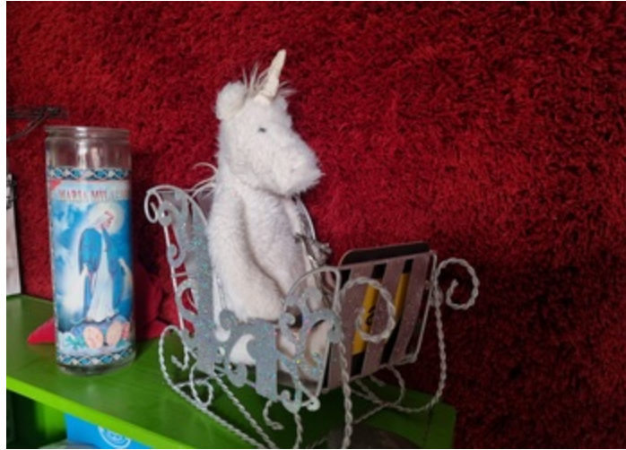
De Unicorn, hij steunt mij al vele jaren bij het computerwerk.

Kijk maar op deze link op de website van samenwerkennederland , daar staan diverse artikelen over de machten en krachten die wereldwijd "eigenlijk" aan de touwtjes trekken. Maar goed, dat gezegd hebbende en je leest dit nog, welkom.