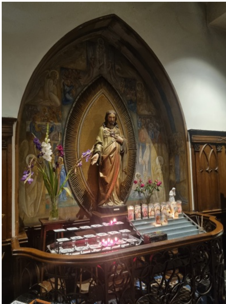
Een moment van meditatie en gebed.